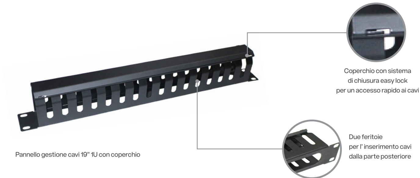
Pannello gestione cavi 19" 1U con coperchio

Coperchio con sistema di chiusura easy lock per un accesso rapido ai cavi