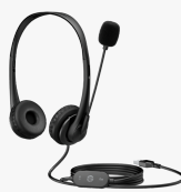
Cuffie stereo USB HP G2 428H5AA