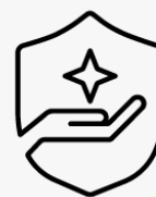
Ritiro e restituzione per 3 anni U1PS3E