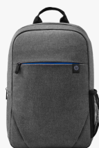
Zaino HP Prelude da 15,6" 2Z8P3AA