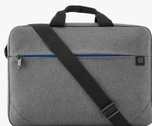
Borsa per notebook HP Prelude da 15,6" 2Z8P4AA