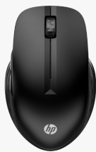
Mouse wireless multi-dispositivo HP 430 3B4Q2AA