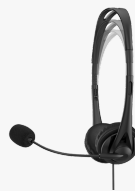
Cuffie stereo HP da 3,5 mm G2 428H6AA